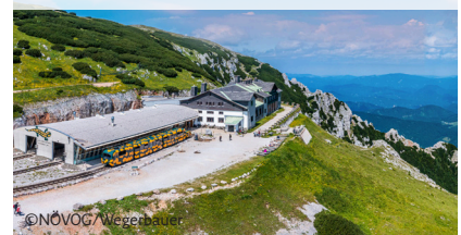
Salamander-Zug mit 111 Sitzplätzen